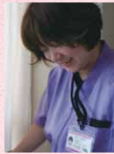
吉田病院 介護福祉士